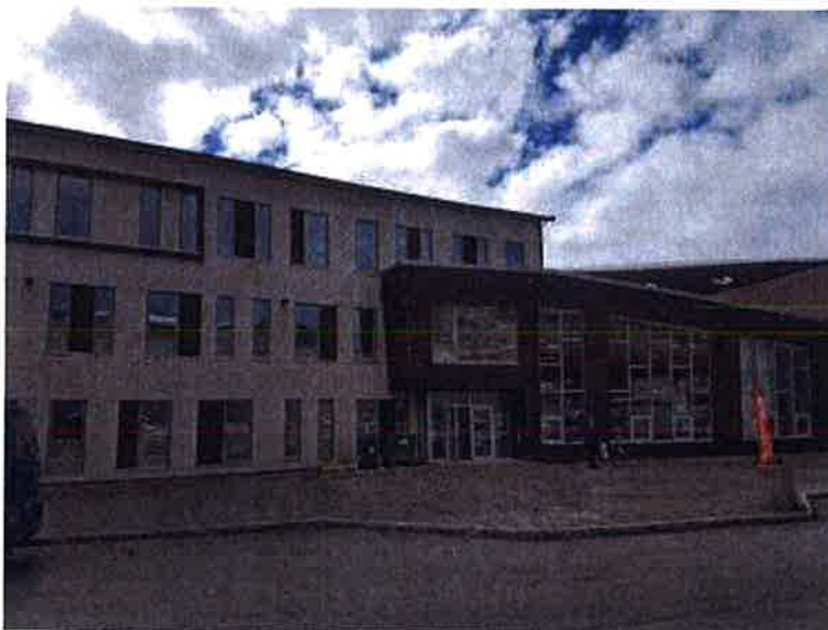
Flerbrukshus i Kjøllefjord, rådhus, bibliotek, kino.

Plankomiteen var i det første møtet samlet i sitt syn på å samle flest mulig funksjoner. De var opptatt av at en samlokalisering av flere funksjoner krever planlegging og samordning. Noen var også opptatt av å skape faglige miljø, både for ansatte og brukere. Man så for seg å skape et kompetansemiljø og arbeidsmiljø for de ansatte i disse virksomhetene, i tillegg til det faglige og praktiske samarbeidet og samordninga. I den forbindelse kom det opp et forslag om å samle kulturskolen, ungdomsklubben og biblioteket i Samfunnshuset. På plankomiteens andre møte 23. Juni, var plankomiteen tydelig på at bibliotekets og barnehagens behov måtte ivaretas, da de har svært dårlige lokaler i dag. Plankomiteen ville ha et alternativ med nybygg som inkluderer tilbudene skole, barnehage, bibliotek, idrettshall og basseng.