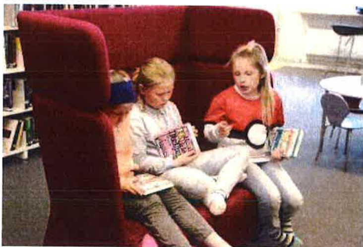
Vardø bibliotek.

Biblioteksjefen er opptatt av biblioteket kan være et møtested i kommunen, med funksjonelt lokale og oppdaterte digitale media og teknisk utstyr.