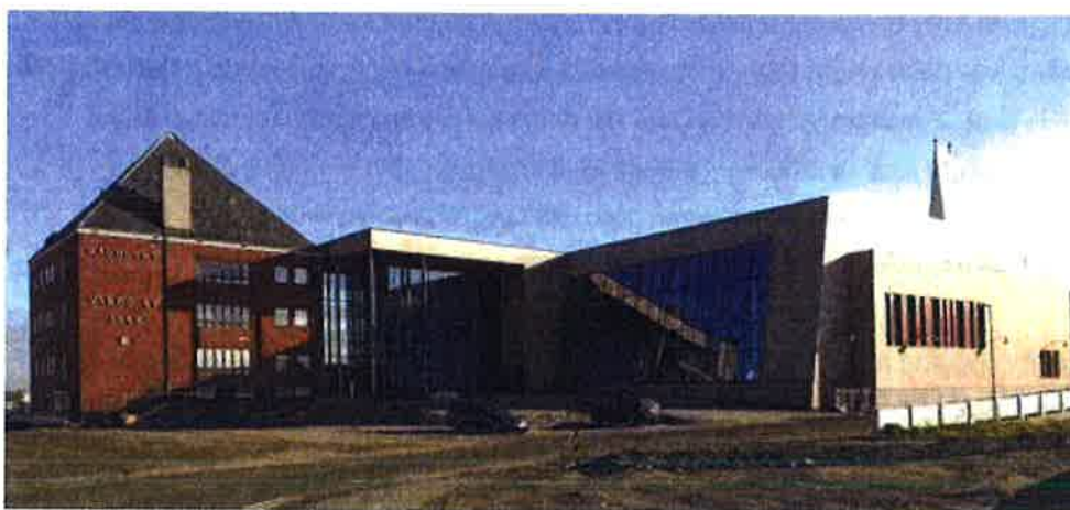
Flerbrukshuset i Vardø med rådhus, basseng, bibliotek, kino, treningsrom, kultursal, vrirlehall.