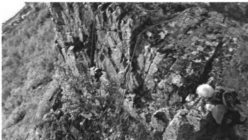
Figur 13. Løsthengende sikringswirer på den sørlige av Hornet

Rundt de mest oppspruknete partiene er det spent sikringswirer med diameter 25- 30 mm.