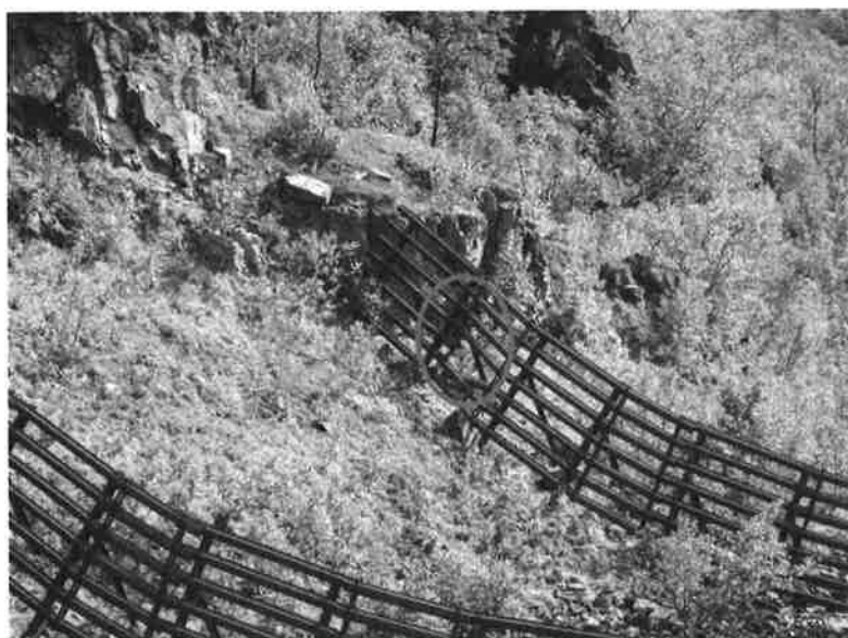
Figur 17. Detalj av skadet bjelke (Rødt)

Forbygningene ser ut til å være i god stand. For noen år siden falt det ut en steinblokk fra fjellsiden ovenfor forbygningene og skadet en horisontal bjelke i nederste rad, se Figur 17. I samme rad, lengst mot nord er enkelte av bjelkene ute av stilling.