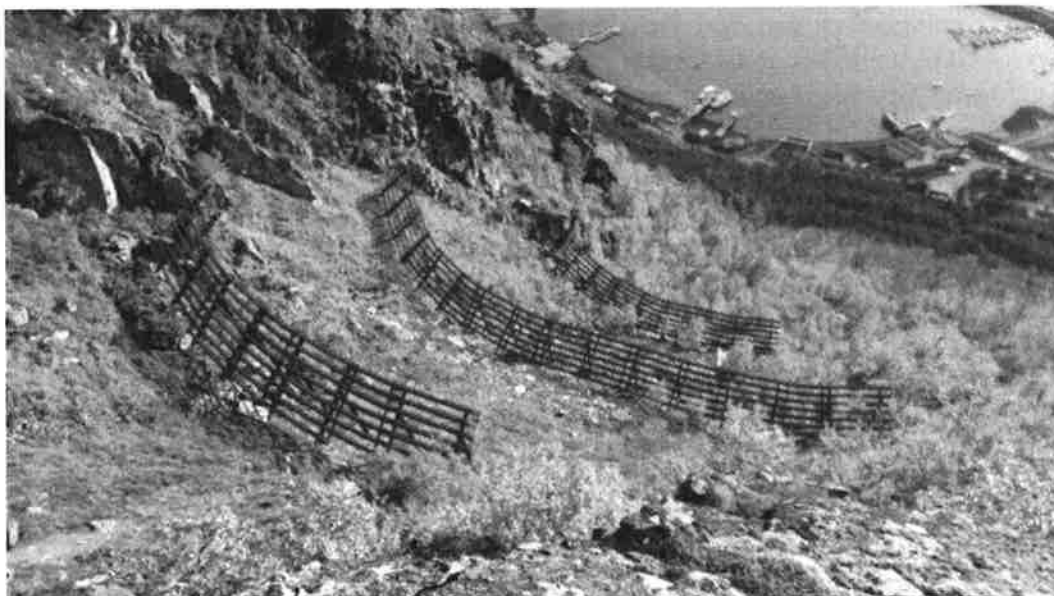
Figur 16. Oversiktsbilde av støtteforbygninger

Forbygningene ser ut til å være i god stand. For noen år siden falt det ut en steinblokk fra fjellsiden ovenfor forbygningene og skadet en horisontal bjelke i nederste rad, se Figur 17. I samme rad, lengst mot nord er enkelte av bjelkene ute av stilling.