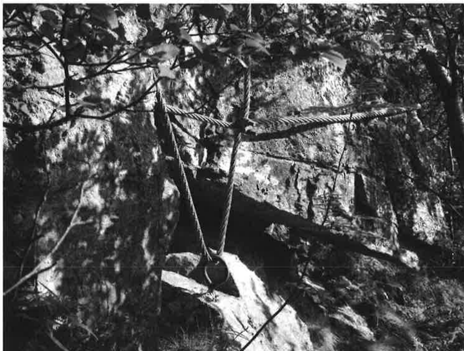
Figur 6. Sikring av avløst blokkparti ved Plataet nr 7.

Like ovenfor eneboligen ved Plataet nr 7 ligger et avløst og oppsprukket parti der det er spent ut wirestropper, diameter ca 20 mm. Wirestroppene er festet til øyebolter av rundjern, diameter ca 15 mm. Øyeboltene er støpt inn fjell/blokker. Wirene er låst med wireklemmer, se Figur 6 og Figur 7.