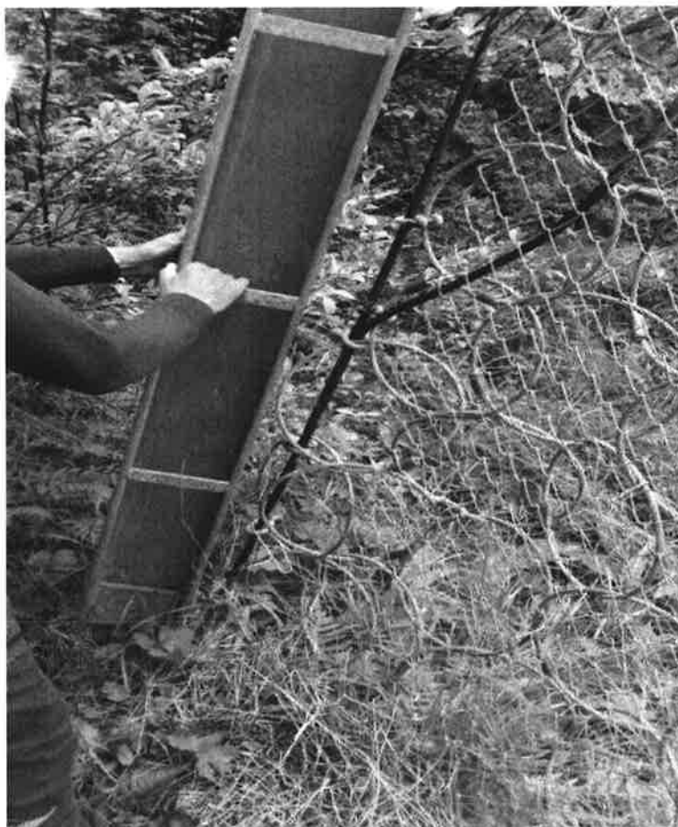
Figur 5. Korrosjon på vertikal bærewire