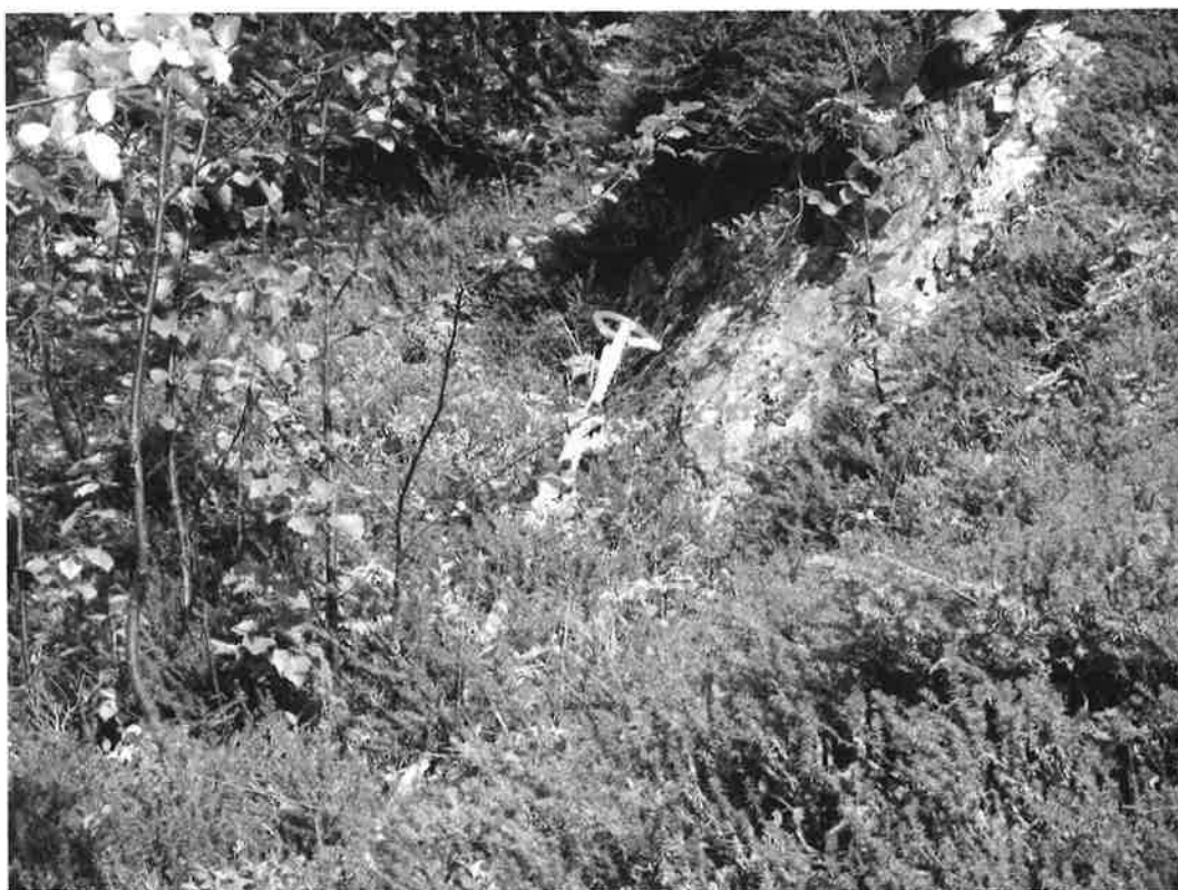
Figur 7. Wire med wireklemmer og øyeboltforankring.

Kostnad: kr 20.000,- -25.000 pr. 1.m, totalt kr 400.000-500.000,- eks MVA.