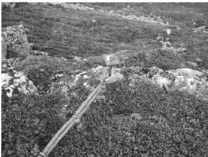
Figur 14. Festemetode for sikringswirer

Rundt de mest oppspruknete partiene er det spent sikringswirer med diameter 25- 30 mm.