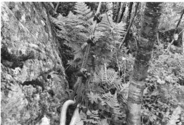
Figur 4. Korrosjon på sideforankring