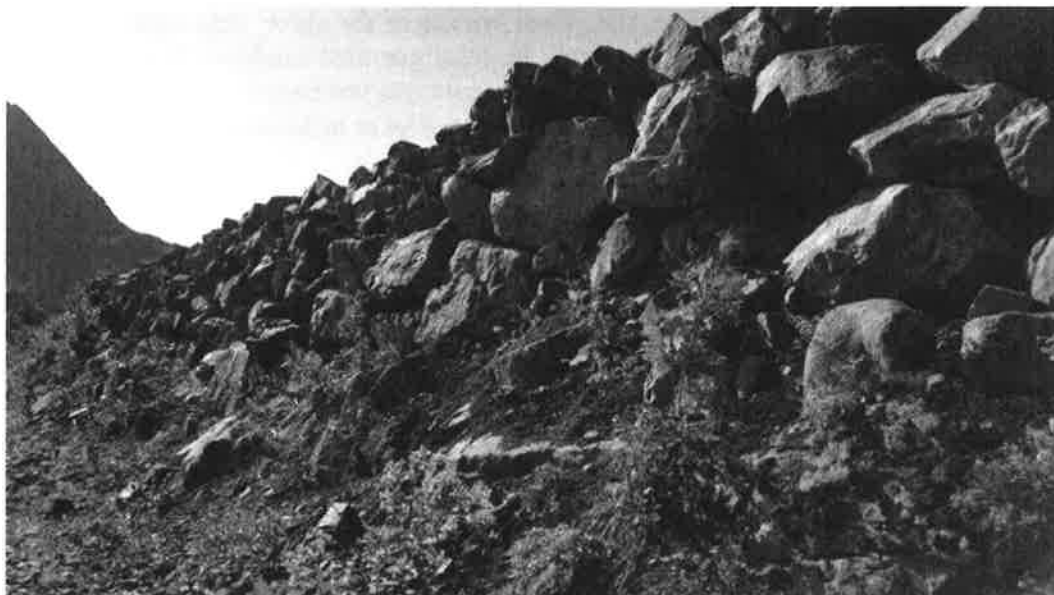
Figur 15. Oppsiden av sikringsvallen

Tørrmuren på oppsiden har preg av å være relativt ujevn og med flere blokker som ikke ligger stabilt. Det har også forekommet enkelte utfall av blokker. Det ble ikke funnet sprekker i toppen av vollen som kunne indikere at større områder er ustabile eller på vei til å gli ut.