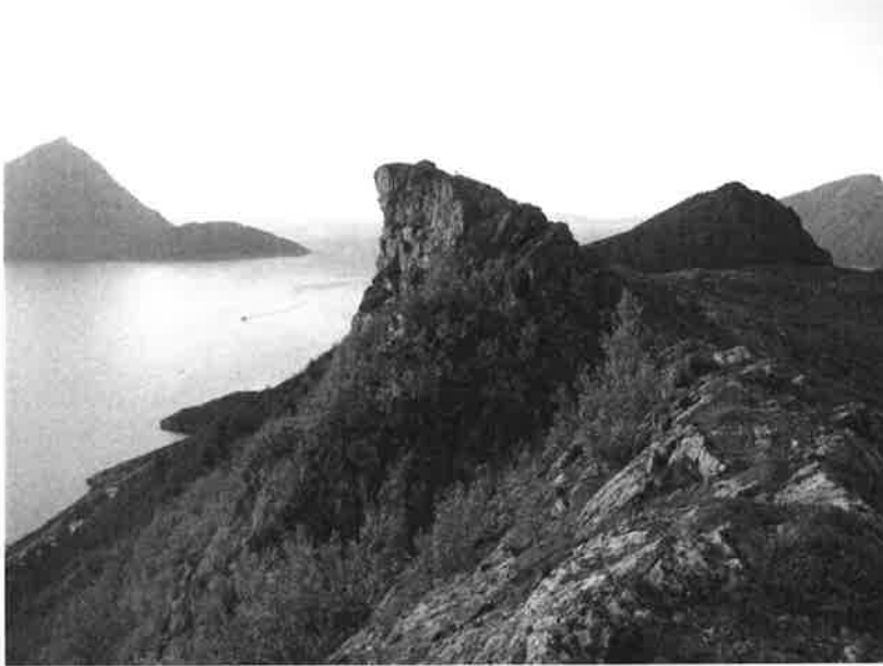
Figur 11. Hornet sett fra sør

Hornet er ca 20 m høyt, bratt oppsprukket fjellparti der større og mindre avløste blokker hviler på steile, utover hellende underslepper. Partiet er delt to, en nordre del med dimensjon ca 5 \times 1,5 \times 4 \text{ (m)} = 30 \text{ m}^3 og en sørlig del med omtrentlig dimensjon 10 \times 10 \times 15 \text{ (m)} = 1500 \text{ m}^3 , se Figur 11 og Figur 12.