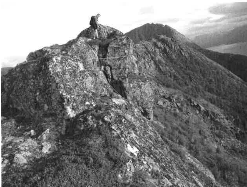
Figur 12. Nordlig del av Hornet sett fra nord. Sikringswirer kan skimtes

Hornet er ca 20 m høyt, bratt oppsprukket fjellparti der større og mindre avløste blokker hviler på steile, utover hellende underslepper. Partiet er delt to, en nordre del med dimensjon ca 5 \times 1,5 \times 4 \text{ (m)} = 30 \text{ m}^3 og en sørlig del med omtrentlig dimensjon 10 \times 10 \times 15 \text{ (m)} = 1500 \text{ m}^3 , se Figur 11 og Figur 12.