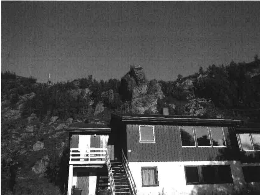
Figur 8. "Tårnet" ovenfor Platået 29-35.

Den nordligste og den nedre delen av Tårnet er ikke sikret, men de delene som er sikret er sannsynligvis de med minst sikkerhet mot utglidning.