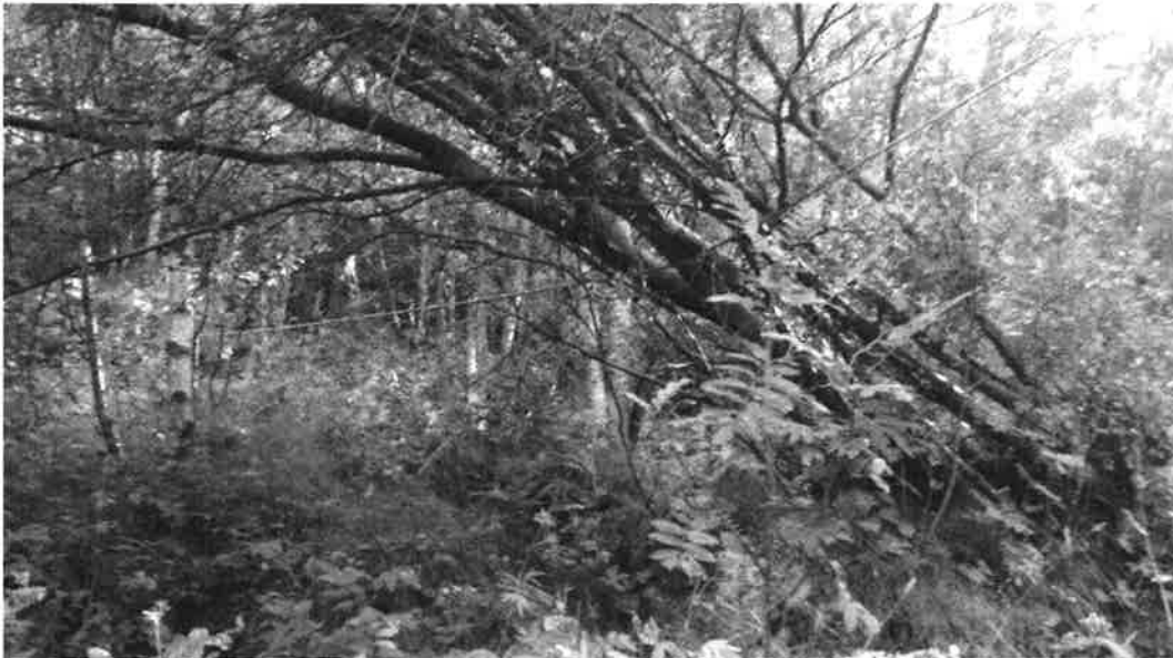
Figur 1. Trær har lagt seg opp mot strekkforankring

Flere av stolpene i gjerdet er kommet ut av stilling. På to steder er stolpefundamentet forskjøvet og ustabil, dette gjelder stolpe nr 7 fra sør i rad 1 og nordligste stolpe i rad 3. Skogvegetasjonen langs gjerdene vokser dels gjennom wirenettet flere steder, og trær har lagt seg over flere barduner og belaster disse, se Figur 1. Mellom stolpe nr 11 og 12 er bakkeklaringen ca 1 m, dette er vesentlig større enn prosjektert.