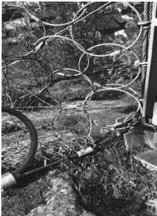
Figur 3. Korrosjon på bunnwire