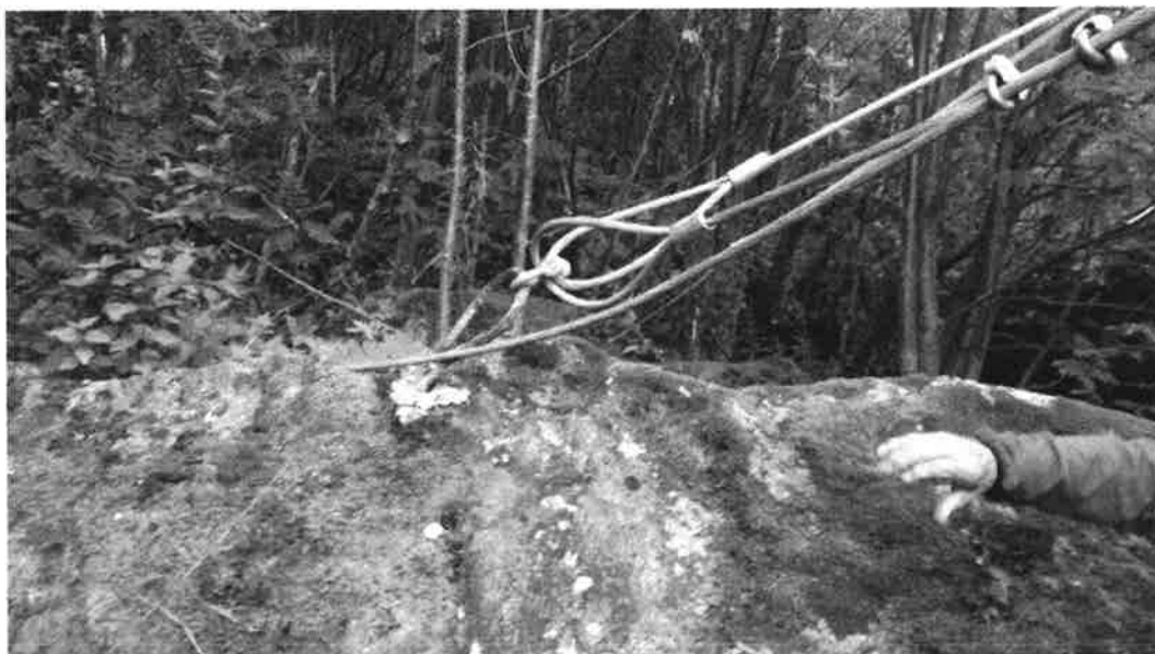
Figur 2. Eksempel på korrodert forankring

Det finnes også noe korrosjon på wireklemmer. Enkelte steder er også forankringen av barduner korrodert, se Figur 2.