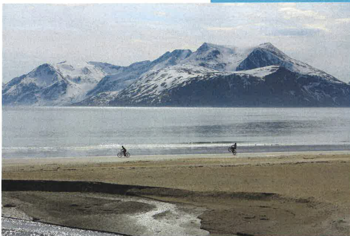
Månedens bilde