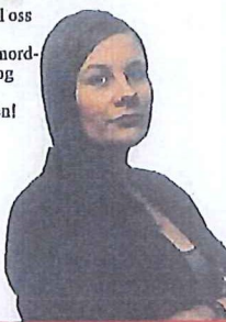
Silje Solstad - nordlys.no

Skriv til oss på leser@nordlys.no og delta i debatten!